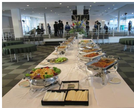
ホスピタリティラウンジ ビュッフェイメージ

※6 人目以降のご利用は、事前申込が必要となります。 前述のダウンロードページにて別途ご案内させていただきます。