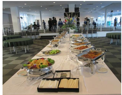
ホスピタリティラウンジ ビュッフェイメージ