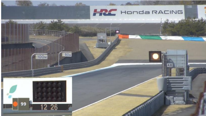
<図1 全ポスト オレンジボール旗提示イメージ>