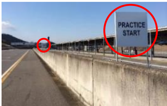
〈図3 スタート練習位置看板〉