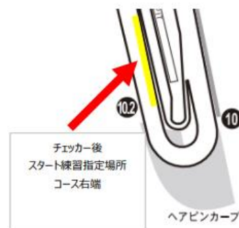
〈図4 スタート練習位置看板詳細〉