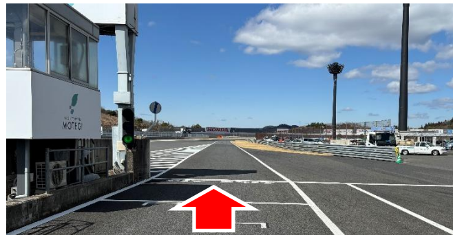
②ピットレーン出口(資料 2 項)