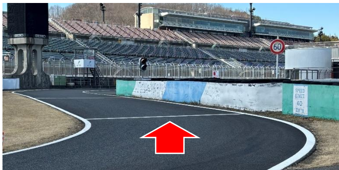
① ピットレーン入口(資料 2 項)