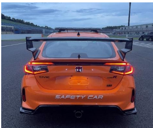
⑤セーフティカー(資料 13 項)