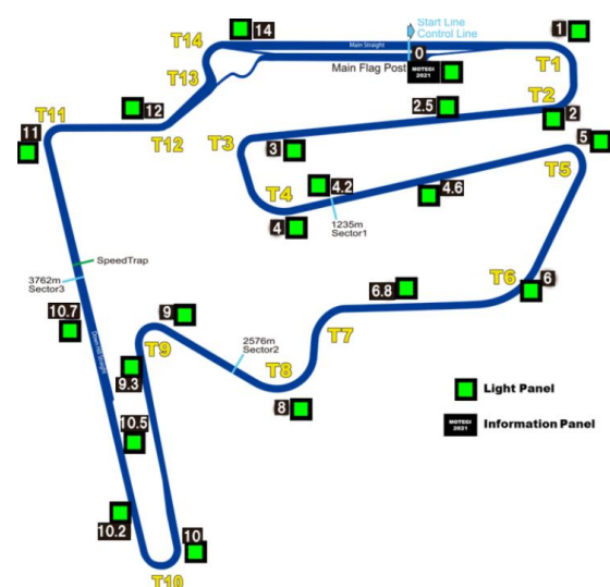
④ライトパネル設置個所(資料 4 項)