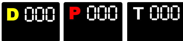
⑥ペナルティボード(資料 15 項)