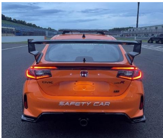
⑤セーフティカー(資料 13 項)