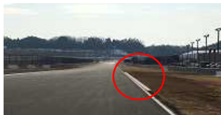
第 2 コーナー立ち上り右側