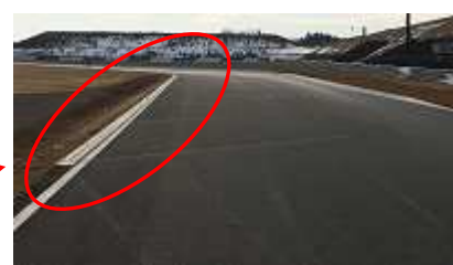
130R コーナー立ち上り左側