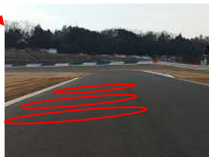
V字コーナー入り口左側