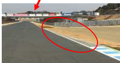
第 4 コーナー立ち上り右側