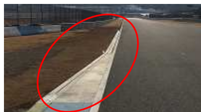
第 2 コーナー立ち上り左側