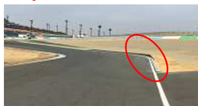
セカンドアンダーブリッジ出口右側

【お問い合わせについて】 ツインリンクもてぎ モータースポーツ課 TRMC-S 事務局 TEL : 0285-64-0200