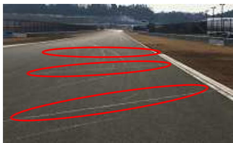
2コーナー立ち上がり右側