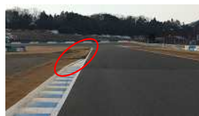
S 字コーナー立ち上がり左側 V 字コーナー進入左側