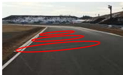
S字コーナー入り口左側