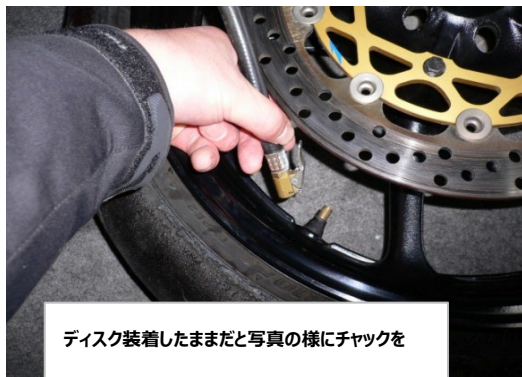
ディスク装着したままだと写真の様にチャックを

※写真の状態でお持ち下さい。 カラー等は紛失の恐れが在り ますので外してお持ち下さい。