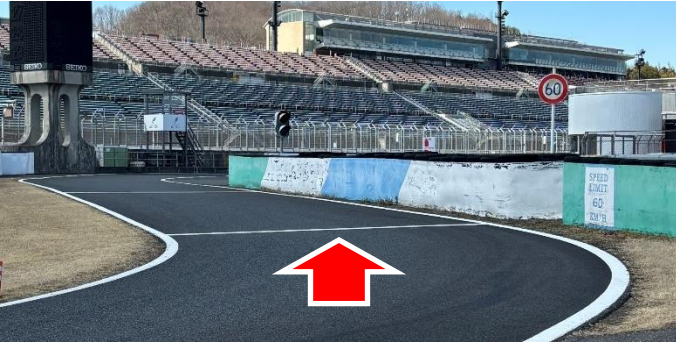
① ピットレーン入口 (資料1項)