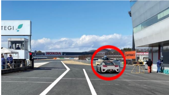
③ スタート練習場所 (資料2項)