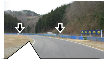
隊列復帰禁止区間のパイロンはSUNOCO看板過ぎの両サイドに設置される。