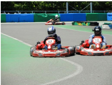
イン側をキープしてライバルを押さえこむ！