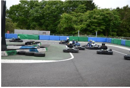
レース開始直後の集団でのブレーキング時は特に要注意！