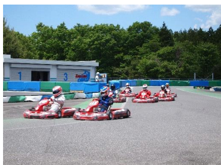
並走時はお互いに1台分スペースを空けてクリーンにバトル！