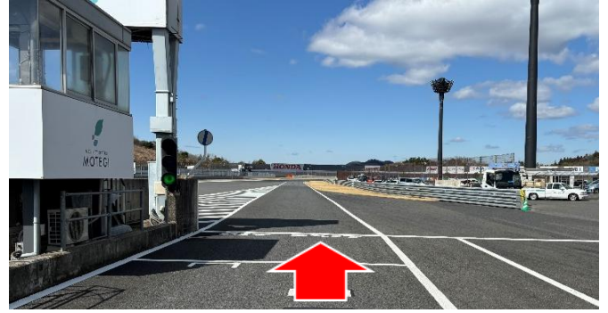
②ピットレーン出口(資料1項)