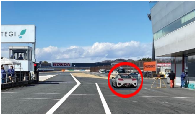
③ スタート練習場所(資料2項)