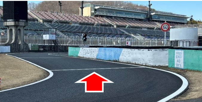
① ピットレーン入口 (資料1項)