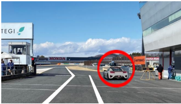
③ スタート練習場所 (資料2項)