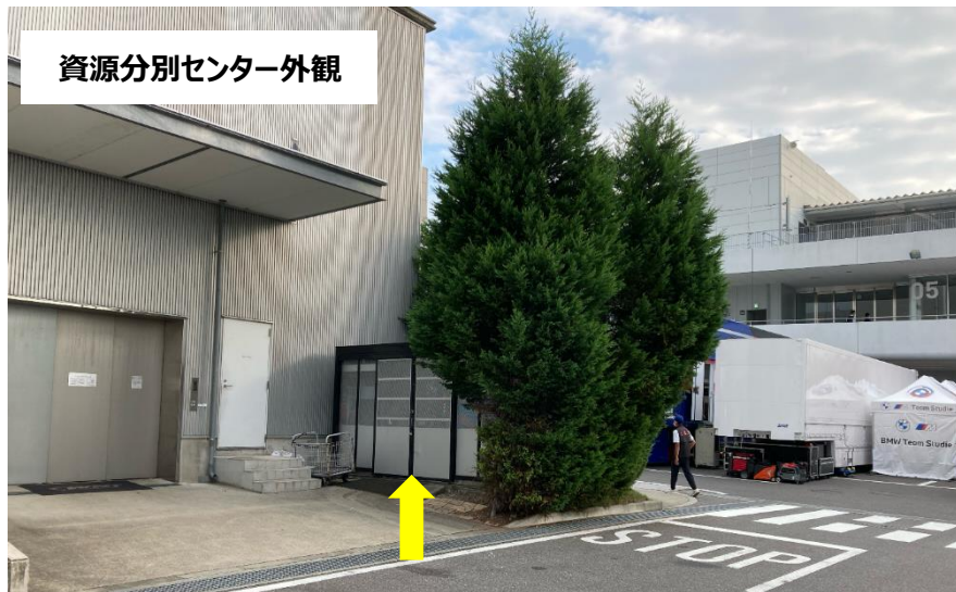
資源分別センター外観