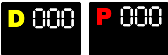
⑦ペナルティボード(資料 16 項)