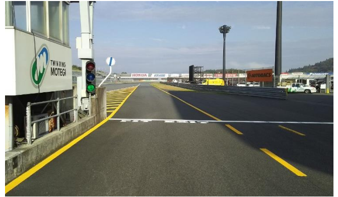
②ピットレーン出口(資料 1 項)