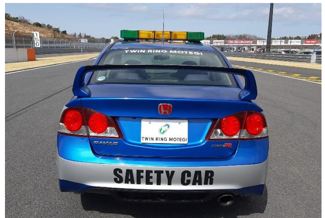
⑥セーフティカー(資料 15 項)