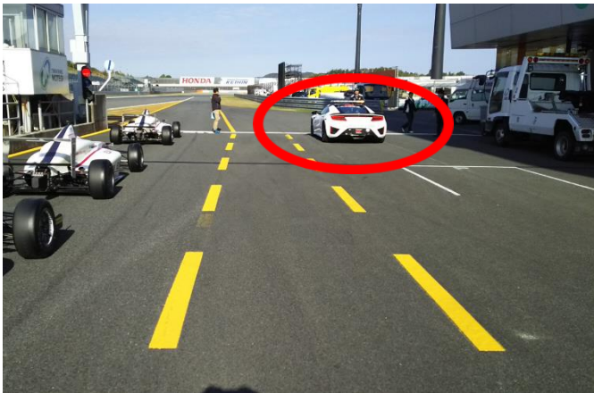
③スタート練習場所(資料 2 項)