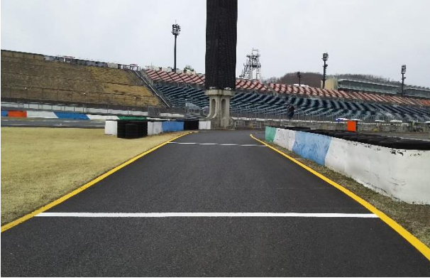
① ピットレーン入口(資料 1 項)