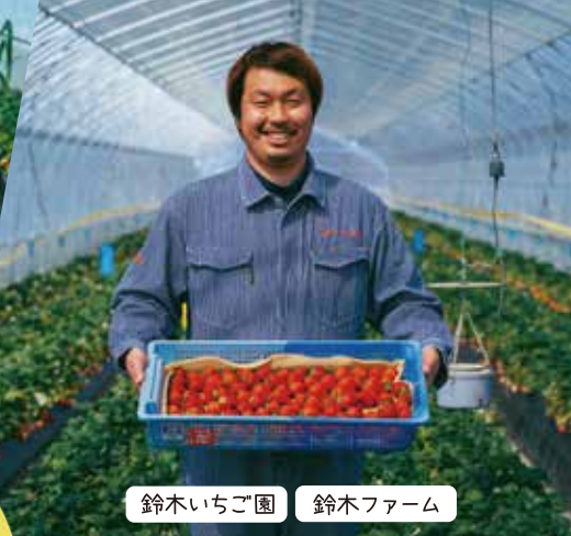
鈴木いちご園 鈴木ファーム