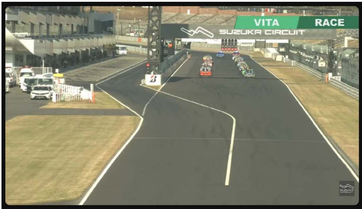
VITA RACE1決勝レースライブアーカイブ ※画像をクリックするとYouTubeライブに遷移します