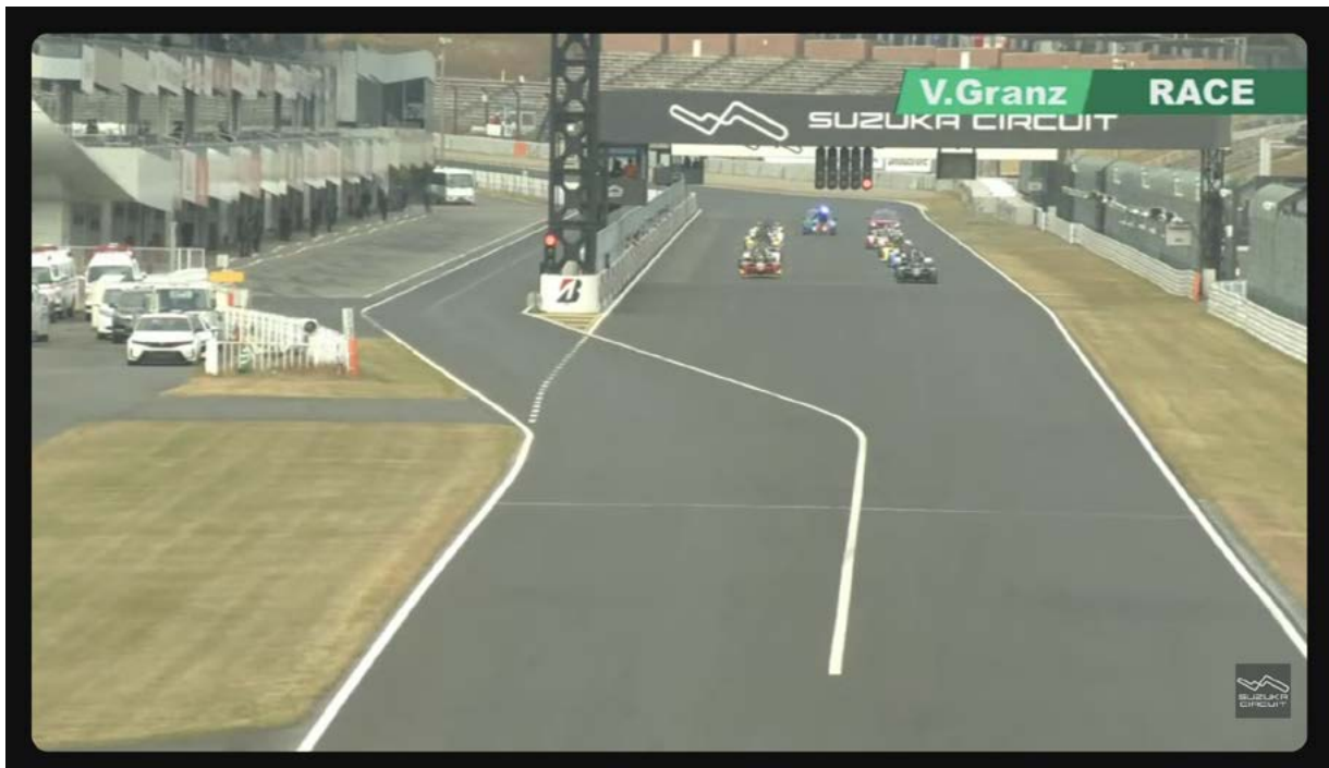
v.Granz 決勝レースライブアーカイブ ※画像をクリックするとYouTubeライブに遷移します