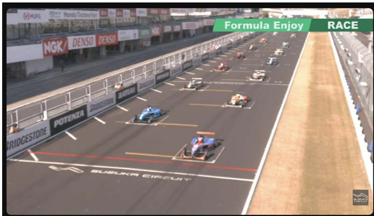
フォーミュラEnjoy 決勝レースライブアーカイブ ※画像をクリックするとYouTubeライブに遷移します

5番手を狙いジョニー小倉、土屋務、前田公孝といったマイスターズ・カップの3台がバトルを繰り広げる。吉田はトップを単独で走り、村瀬、中島が2番手争いを繰り広げる。レースは吉田が完勝と呼べる内容でポールtoウィン。2位に中島、3位に村瀬が入った。マイスターズ・カップはジョニー小倉、前田、土屋の順でチェッカーを受け、2位の前田がシリーズチャンピオンを獲得した。