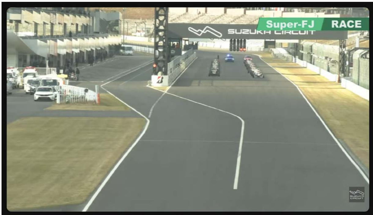
スーパーFJ 決勝レースライブアーカイブ ※画像をクリックするとYouTubeライブに遷移します

7周目からリスタート。吉田はトップをキープ、酒井、鈴木の上位3台にバトルは見られず、ジェントルマンクラスのトップは中嶋匠になる。鈴木、箕浦、杉田悠真の3番手争いが激しい。2番手の酒井を抑え、レースは吉田がポールtoウィン。2位チェッカーの酒井がシリーズチャンピオンを獲得、バトルを制した鈴木が3位になった。