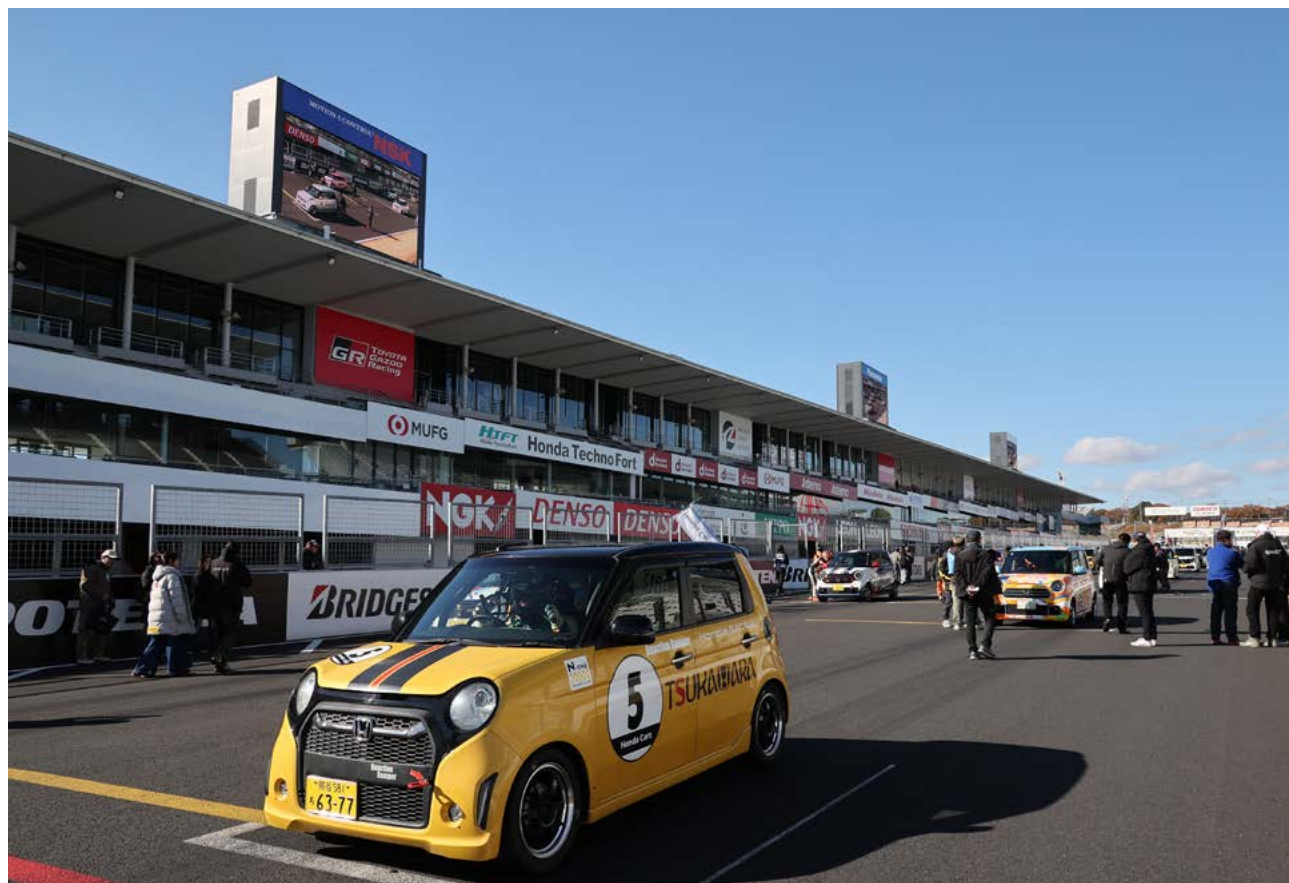
土曜日に行われた、N-ONE OWNER'S CUPレース。鮮やかなカラーリングをまとった50台がエントリーした

SUZUKA CHAMPION CUP RACEと名称を変え、新しい歴史を一步步ずつ進む大会の2025年シーズンは、多くのレースファンに見守られ、無事に全日程を終えた。