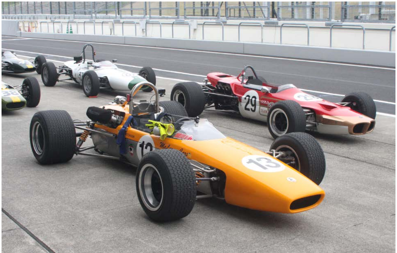
併催イベントとして行われたヒストリックフォーミュラレジスター。往年の名車がジェントルドライバーの手により鈴鹿を駆け抜けた

日曜日の鈴鹿上空は終始雲に覆われたものの、路面は最後までドライをキープ。天候や大きなアクシデントに悩まされることなく、多くのドライバーがサーキット走行という貴重な時間を最後まで楽しんでた。