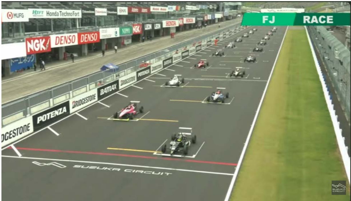
FJ1500／スーパーFJ 決勝レースライブアーカイブ ※画像をクリックするとYouTubeライブに遷移します

ペースを上げる井出は、着実に前を抜き2番手へ。井出と宮本は交互にトップに立つバトルを繰り広げると、田崎も加わり三つ巴の戦いでファイナルラップへ。すると田崎がスピンを喫してしまう。宮本が井出を抑えてトップで通過するが、レース後、宮本にドライバーの遵守事項違反によるペナルティが課され、優勝は井出となった。