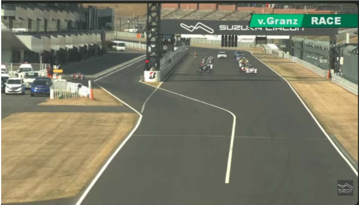
v.Granz 決勝レースライブアーカイブ ※画像をクリックするとYouTubeライブに遷移します

金澤、兒島、山下、関、佐々木光、入谷敦司の順で周回を重ねる。セーフティカー解除後のリスタートも見事に決めて金澤はトップをキープするが、2番手の兒島も金澤との差を広げさせない。終盤にかけてトップ2はテールtoノーズの膠着状態のまま、いよいよファイナルラップへ。勝負に出た兒島は、金澤をオーバーテイクして逆転。そのまま金澤を振り切ると、トップでチェッカーを受けた。2位は金澤、3位は山下となった。