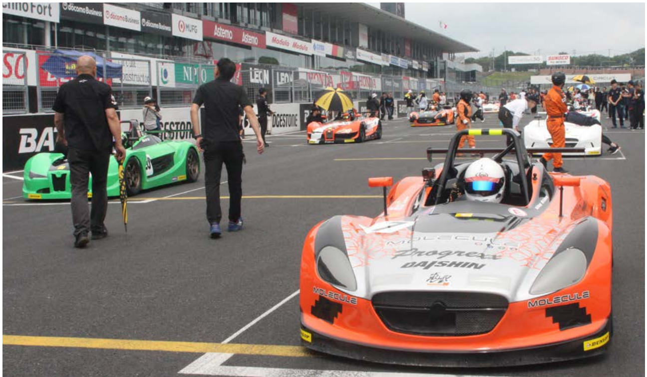
VITAクラスには37台がエントリー! グリッド上をカラフルなレーシングマシンが埋め尽くす様子は壮観だった