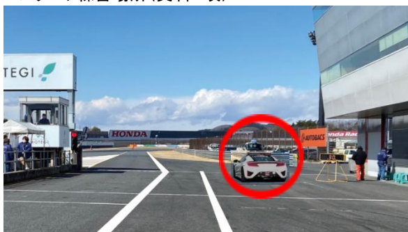
③ スタート練習場所 (資料2項)