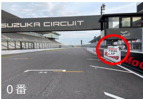
図2. FINAL LAP ボード提示位置