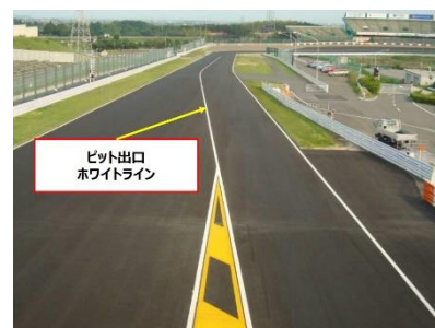
図1.ホワイトライン