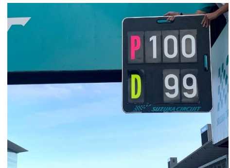
図4. ドライビングスルー/ペナルティストップ