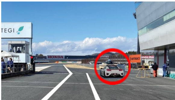
③ スタート練習場所(資料4項)