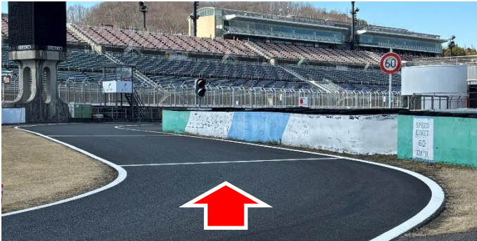
① ピットレーン入口(資料3項)