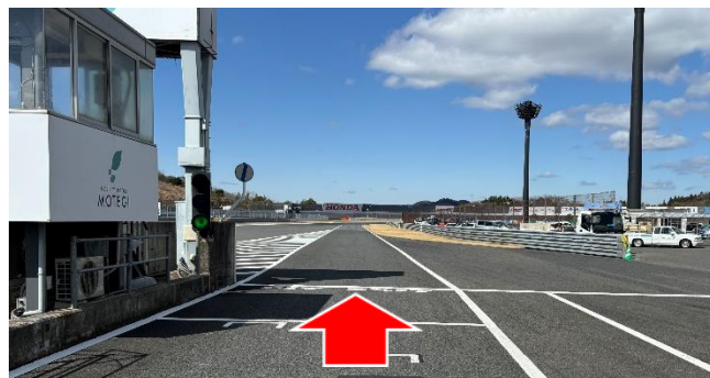
②ピットレーン出口(資料1項)