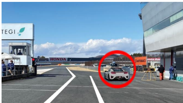
③ スタート練習場所(資料2項)