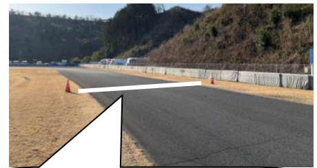
隊列復帰禁止区間のレッドライン&パイロンは SUNOCO 看板過ぎに設置する。