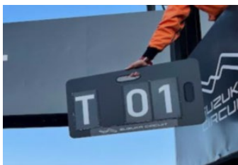
図 2 タイムペナルティ