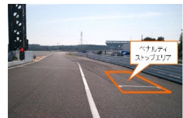
図 4 ペナルティストップエリア