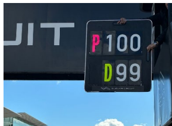
図 3 ペナルティストップ/ ドライブスルーペナルティ