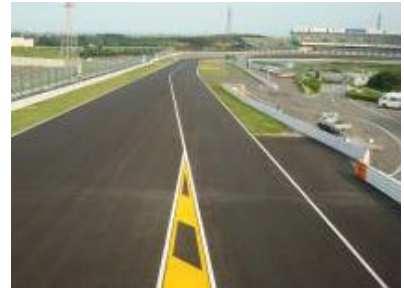
図1 ホワイトライン