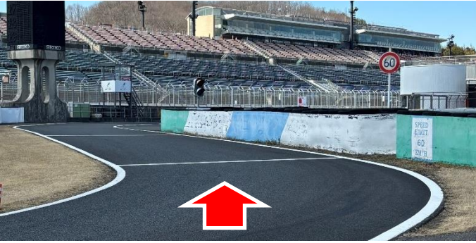
① ピットレーン入口 (資料1項)