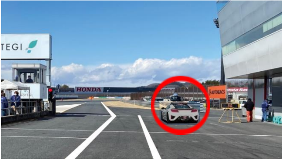
③ スタート練習場所 (資料2項)