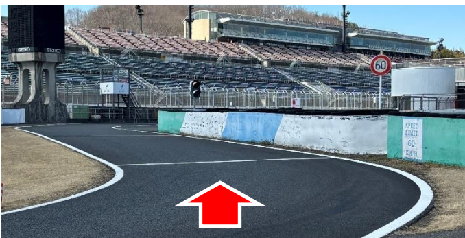
① ピットレーン入口(資料1項)