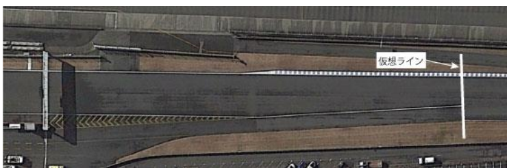
⑤第1セーフティカーライン(仮想ライン)