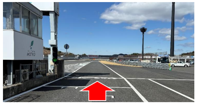
②ピットレーン出口(資料1項)