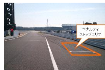
図 4 ペナルティストップエリア