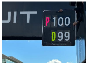
図 3 ペナルティストップ/ ドライブスルーペナルティ