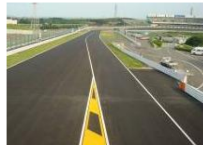
図1 ホワイトライン