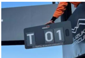
図 2 タイムペナルティ