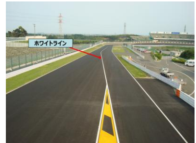
図1 ホワイトライン

公式予選で赤旗となった場合、赤旗提示の原因と特定されたドライバーは、罰則の対象となる場合がある。