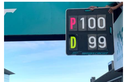
図3 ペナルティストップ/ ドライブスルーペナルティ