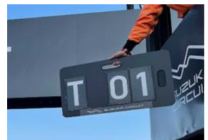
図4 タイムペナルティ