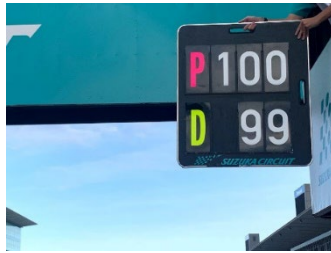
図3 ペナルティストップ/ ドライブスルーペナルティ