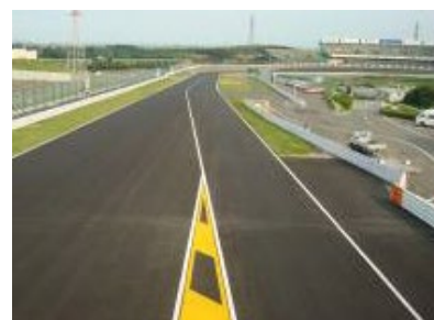
図1 ホワイトライン