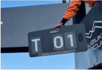
図2 タイムペナルティ

ピットインし、オフィシャルが誘導するパークフェルメに進むこと。 車両保管解除まで競技車両にはオフィシャル以外、一切手を触れてはならない。