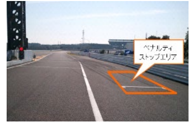
図4 ペナルティストップエリア