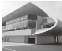
コントロールタワー