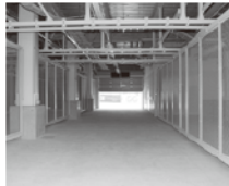
ピットボックス内部