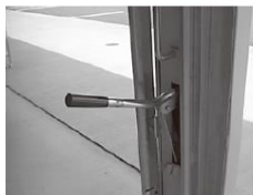
レバーが上がった状態(移動時)

②可動中柱のレバーを上げた状態で、取っ手と可動中柱側面を持って移動させてください。