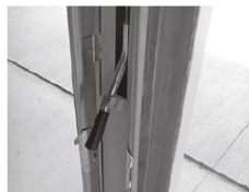
レバーが下がった状態(固定時)