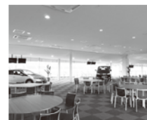
ホスピタリティラウンジ

ピットビル2Fには、食事をしながら観戦が可能なホスピタリティラウンジ11室を設置。食事を楽しみながら、白熱したレース観戦をすることができます。各部屋にはピットレーンに張り出した屋外テラスが100席設けられています。室内には車両搬入も可能で、新車発表会など多目的な使用が可能です。同3階には吹き抜けのホスピタリティテラスを設置、屋外テラス席も完備し、開放的な空間で観戦をお楽しみいただけます。