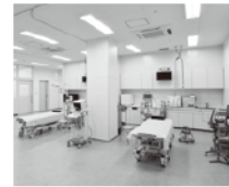
メディカルセンター

ピットビル最終コーナー側1階に設けられたメディカルセンターは、コントロールタワーとの一体化、隣接した救急ヘリポートとあいまって迅速な対応が可能です。