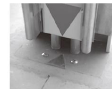
位置合わせマーク

可動中柱下部の位置合わせマーク(▼▲)および上部レールを合わせながらレバーを完全に下げ、固定されたことを確認した後、左右のオーバースライダーを操作してください。